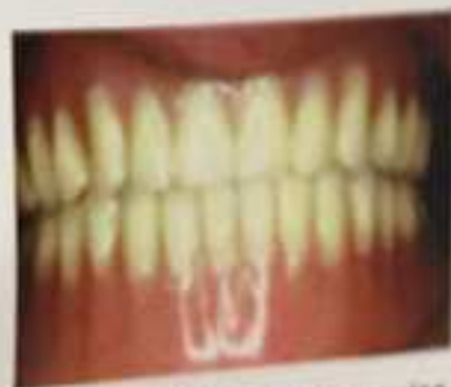
Πλήρεις ή ολικές οδοντοστοιχίες