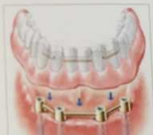
Αποκατάσταση κάτω γνάθου πάνω σε 4 εμφυτεύματα