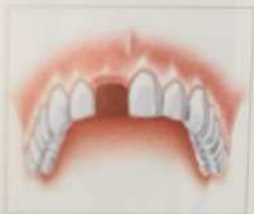
Έλλειψη ενός δοντιού, λόγω π.χ από ατύχημα στα σπορ