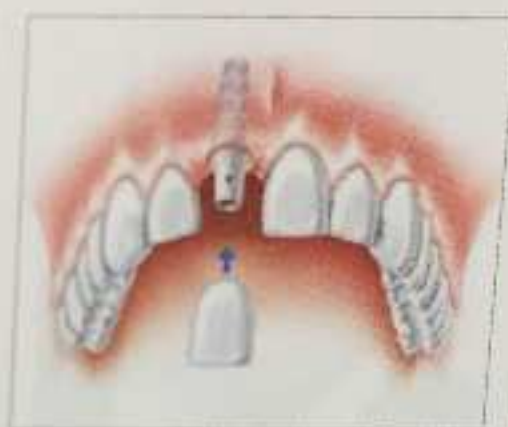
Το τοποθετημένο εμφύτευμα με τη νέα στεφάνη