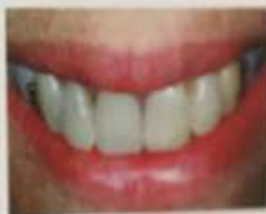
Μερικώς αφαιρούμενες οδοντοστοιχίες