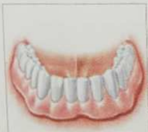
Η οδοντοστοιχία τοποθετείται με μεγάλη σταθερότητα