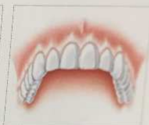
Φυσική αποκατάσταση του εκλειπόντος δοντιού

Οποιοσδήποτε μπορεί να χάσει ένα δόντι και συχνά μέσα σε δευτερόλεπτα, π.χ. κατά την διάρκεια ενός αγώνα. Παρ' όλο που είναι σίγουρα αγχωτικό, σήμερα δεν υπάρχει λόγος ν' ανυσηχεί κανείς.