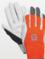
Γάντια Husqvarna Classic light γενικών εργασιών