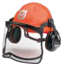
Κράνος Προστασίας Classic