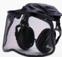
Ωτοασπίδες κήπου με μάσκα από διχτυωτό πλέγμα