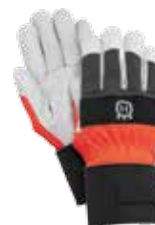
Γάντια Husqvarna Classic πολλαπλών χρήσεων