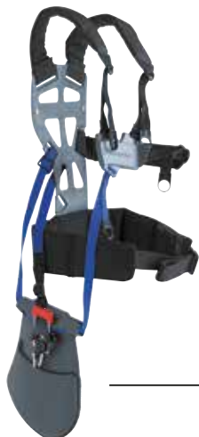
Εξάρτηση Balance X

Σωστή κατανομή του βάρους στους ώμους και στη μέση του χειριστή, για άνετη χρήση του θαμνοκοπτικού.