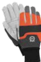
Γάντια Husqvarna Functional με προστασία από αλυσοπρίνο