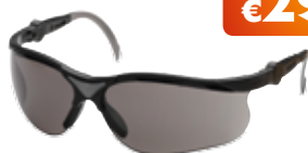
Γυαλιά Προστασίας SUN X