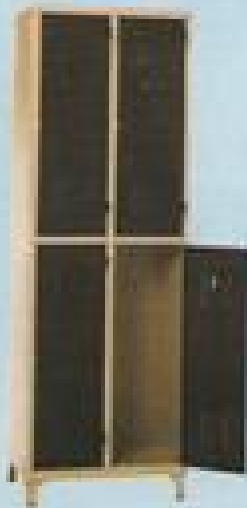
ΙΜΑΤΙΟΘΗΚΗ 4 Π 2171 ΔΙΑΣ. 210X71X40