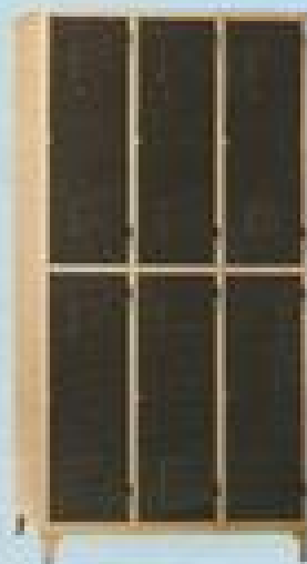
ΙΜΑΤΙΟΘΗΚΗ 6 Π 21105 ΔΙΑΣ. 210X105X40