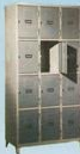
ΙΜΑΤΙΟΘΗΚΗ 12 Π 21106 ΔΙΑΣ. 210X105X40