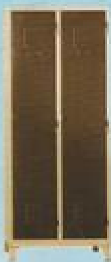
ΙΜΑΤΙΟΘΗΚΗ 2 Π 1771 ΔΙΑΣ. 170X71X40