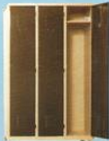
ΙΜΑΤΙΟΘΗΚΗ 3 Π 17105 ΔΙΑΣ. 170X105X40