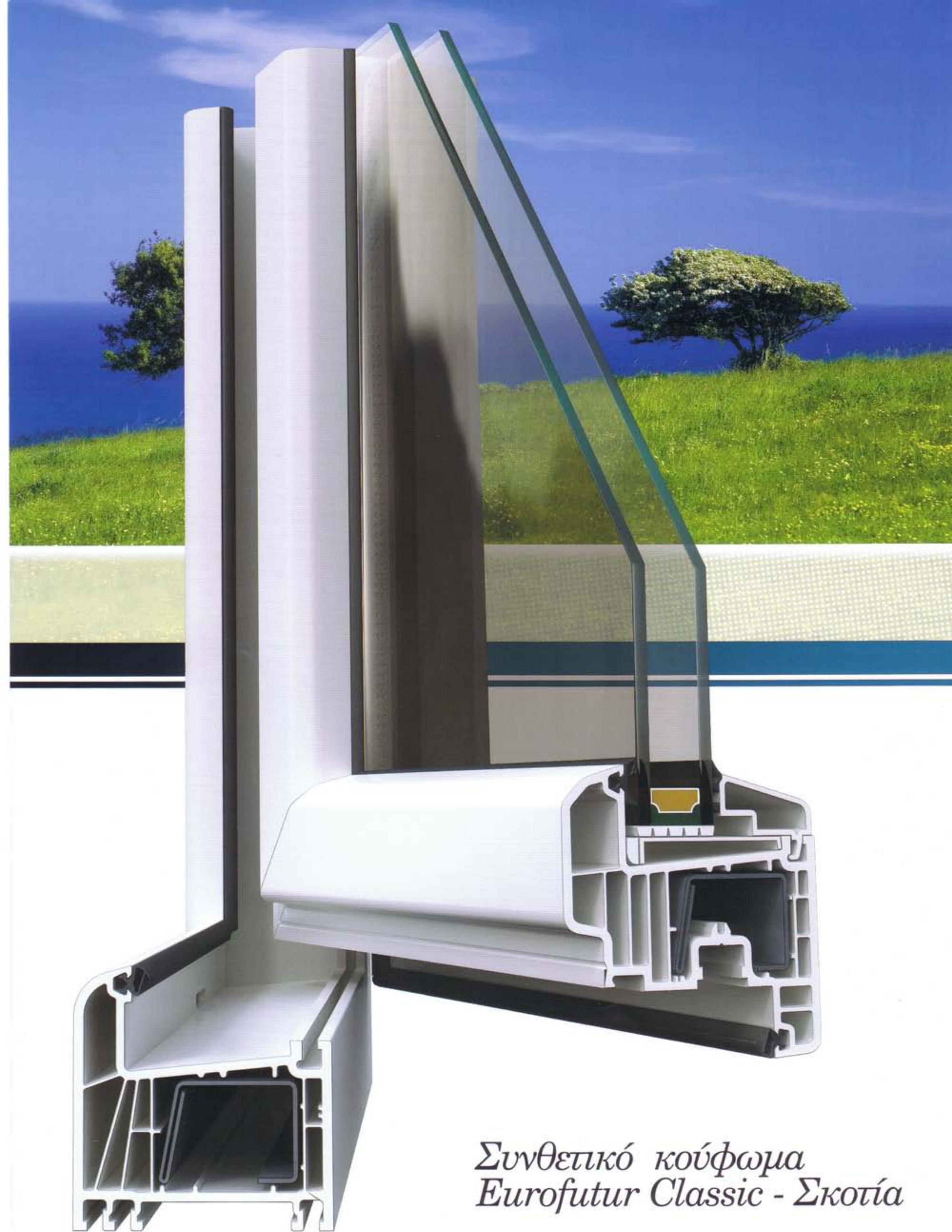
Συνθετικό κούφωμα Eurofutur Classic - Σκοτία