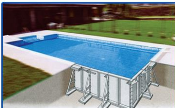
Γραμμικό σχεδιάγραμμα που φαίνεται τμήμα υπέργειας πισίνας